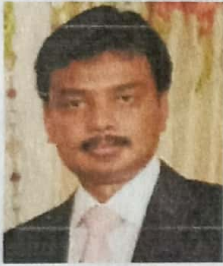
Sri Pradeep P, I.A.S. Commissioner Department of Collegiate and Technical Education Government of Karnataka